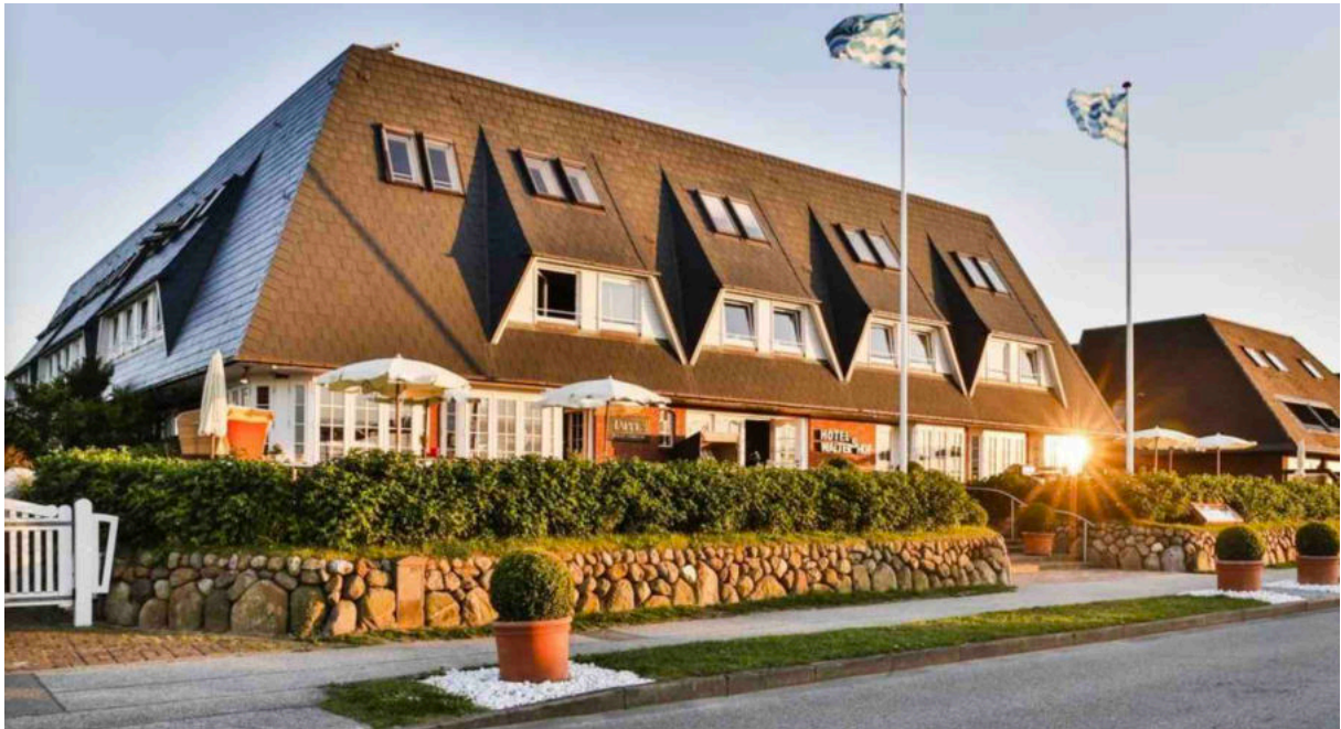
Alle trafen sich dann zum Abendessen im hervorragendem Hotel Rungholt.