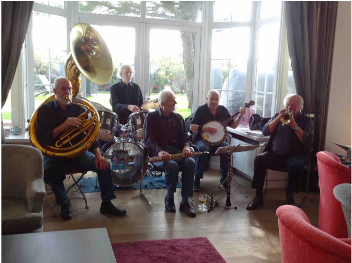
Die vom Festland stammende Dixieland Band Alexandra's Dampfkapelle unterhielt uns mit fetziger Musik - Banjo, Tuba, Saxophone, Klarinette und Posaune.