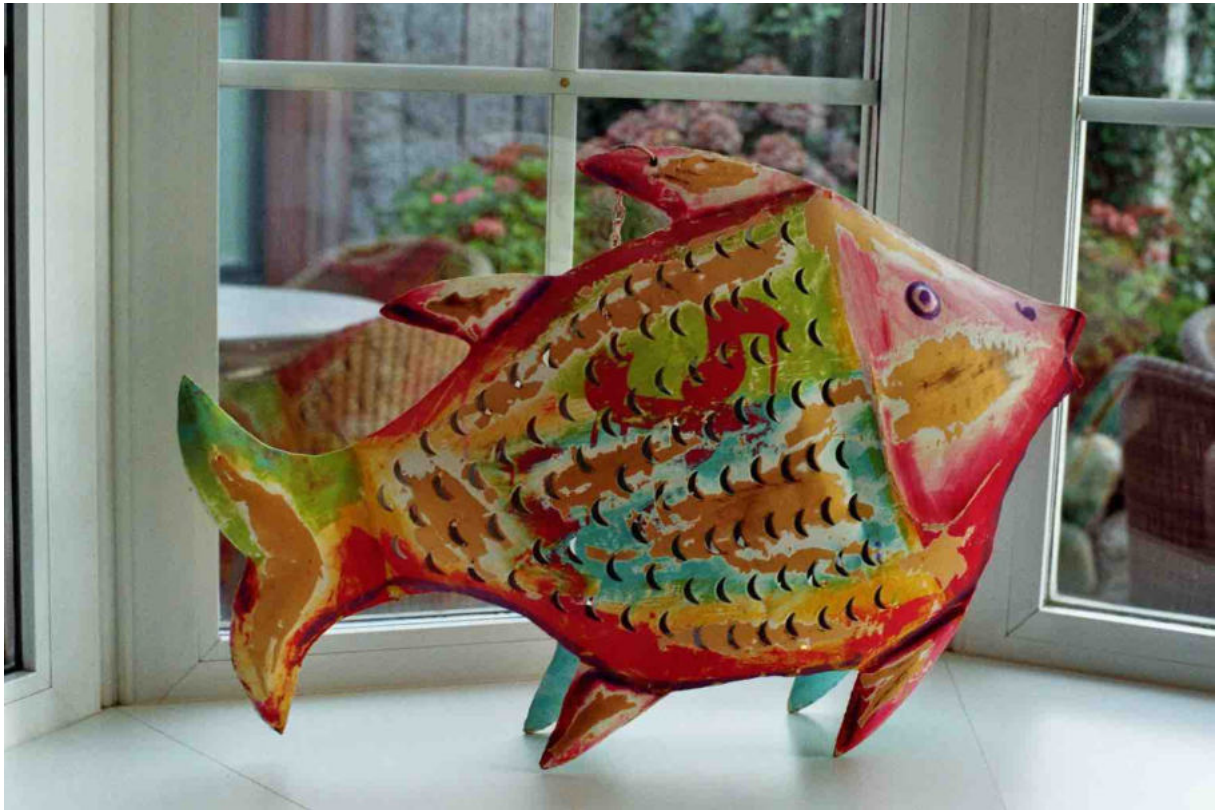
20:00 Dinner im legendären Gogärtchen , Kampen.