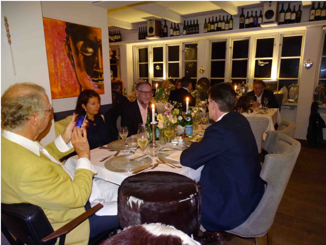
Um 20:00 Uhr folgte das hervorragende Galaessen, wofür wir das Restaurant exklusiv für uns hatten.