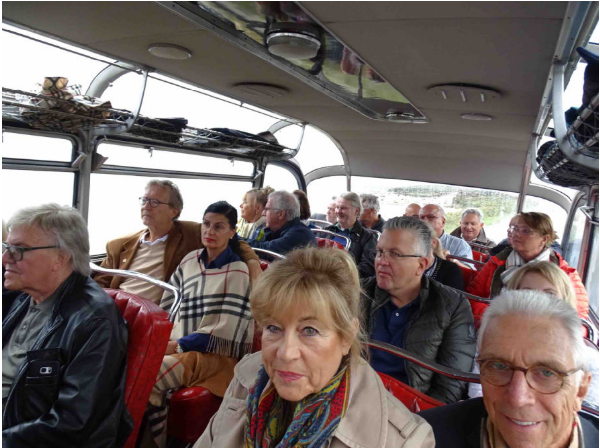
Die Fahrgäste wurden an ihren jeweiligen Hotels abgeholt und dann ging es Richtung List , vorbei an der berühmten Wanderdüne und zum Königshafen .